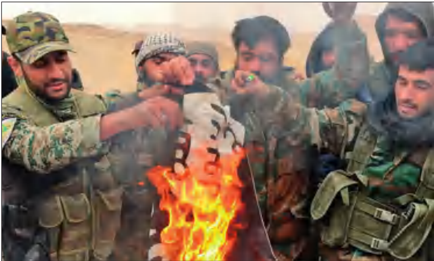
Народные ополченцы САР сжигают флаг ИГИЛ, снятый с отбитой у боевиков цитадели Пальмира.

Современное государство обязано защищать интересы каждого своего гражданина вне зависимости от его расы, национальности, принадлежности к определенной конфессии или религиозной традиции, в то время как ИГИЛ выражает интересы небольшой группы религиозных радикалов, жестоко подавляя остальную часть населения посредством запугивания, насилия и террора.