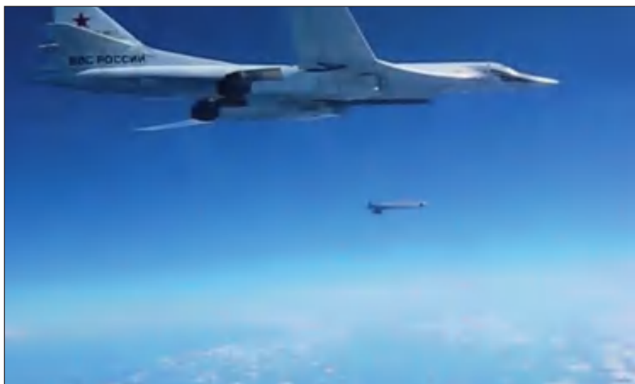
Воздушная операция российских ВКС по уничтожению боевиков ИГИЛ в Сирии.