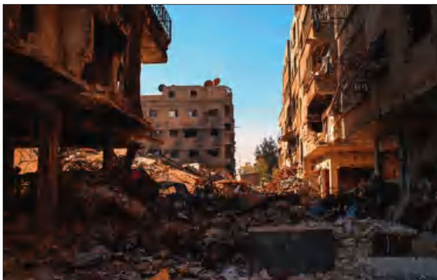
Разрушенный боевиками ИГИЛ Дамаск.

Террористы поставили на поток производство видеороликов с жестокими сценами казней пленников, заложников и «вероотступников». Эти материалы потом широко распространяются в социальных сетях и