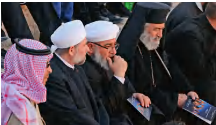
Представители различных конфессий объединились против ИГИЛ. На концерте симфонического оркестра петербургского Мариинского театра в Римском амфитеатре сирийской Пальмиры, освобожденной от террористов ИГИЛ.

В последнее время появилось значительное число верующих, причисляющих себя к крайним религиозным течениям (в СМИ упоминаются как «салафиты», «хариджиты», «ваххабиты»). Однако костяк ИГИЛ составляют лишь люди, причисляющие себя к ультрарадикальному крылу вышеназванных течений.