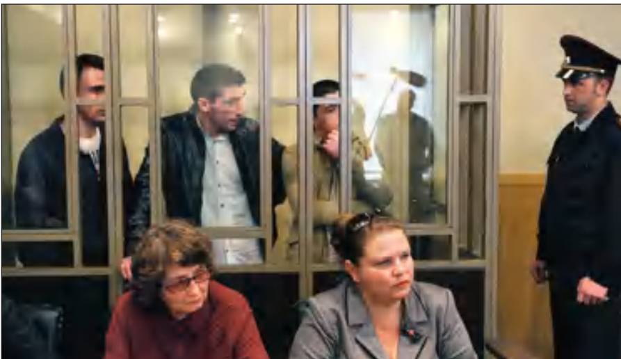
В Российской Федерации предусмотрена административная и уголовная ответственность за пропаганду идей терроризма, участие в деятельности террористических организаций.