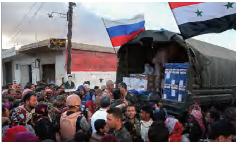
Россия оказывает гуманитарную помощь Сирии.