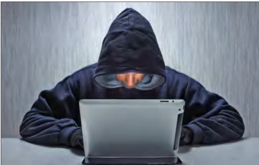
Вербовщики ИГИЛ активно используют Интернет.

Террористы день ото дня совершенствуют методы вербовки новых сторонников, а также алгоритмы их идеологической обработки. Читателю стоит помнить, что те типовые ситуации, которые описаны в данном пособии, можно рассматривать лишь в качестве базовых ориентиров,