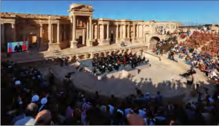
Освобожденная Пальмира. На концерте симфонического оркестра петербургского Мариинского театра под руководством народного артиста России Валерия Гергиева в Римском амфитеатре сирийской Пальмиры, освобожденной от террористов ИГИЛ.