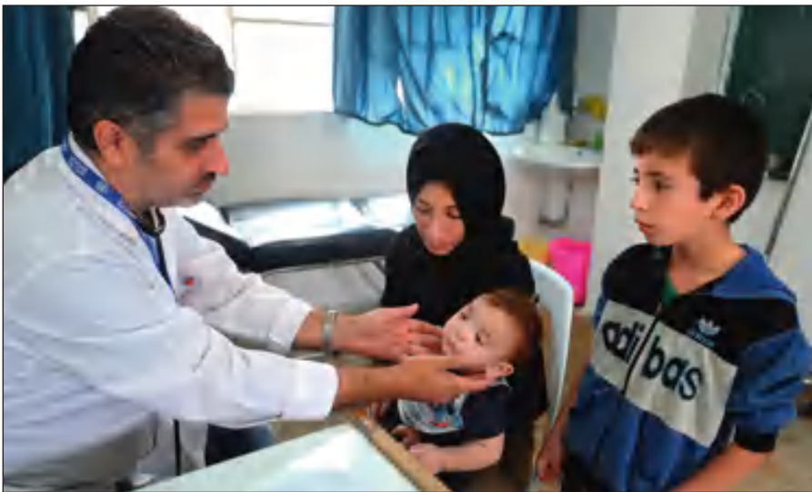
Истинный ислам призывает к состраданию и милосердию. Врач осматривает ребенка в медицинском пункте лагеря при одной из школ Дамаска.

Радикалы объявляют «врагами ислама» всех несогласных с ними мусульман. Ультрарадикальные группировки признают террор и насилие единственным способом достижения провозглашенных ими целей.