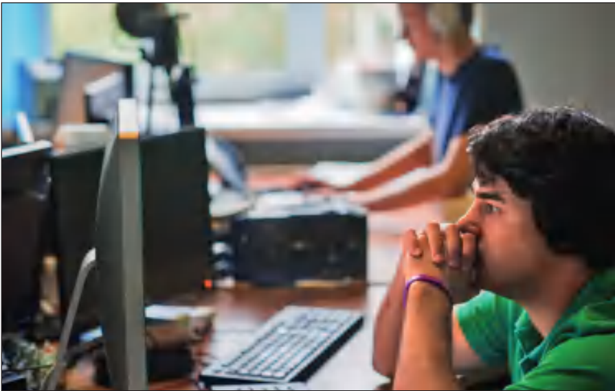
Постоянное присутствие вербовщиков ИГИЛ в соцсетях.

Активисты ИГИЛ поддерживают свои аккаунты в сетях Facebook, Twitter, Instagram, Friendica, Telegram. Активно они заявили о себе и в российских социальных сетях: «ВКонтакте» и «Одноклассниках».