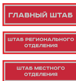
Нарукавный знак, устанавливающий принадлежность к структуре органов ВВПОД «ЮНАРМИЯ»